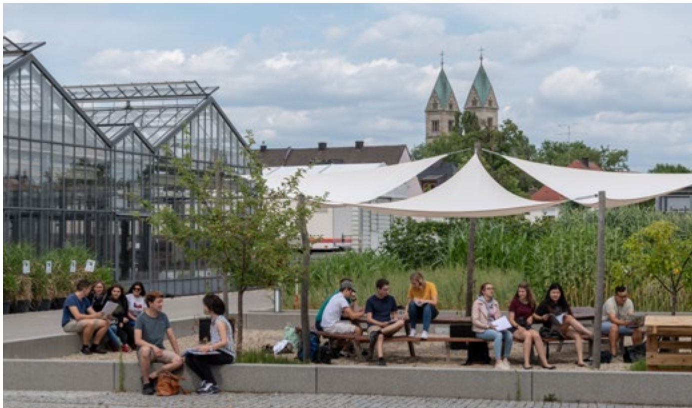
Studierende am Campusgelände in Straubing, im Hintergrund die Türme der Kirche St. Peter