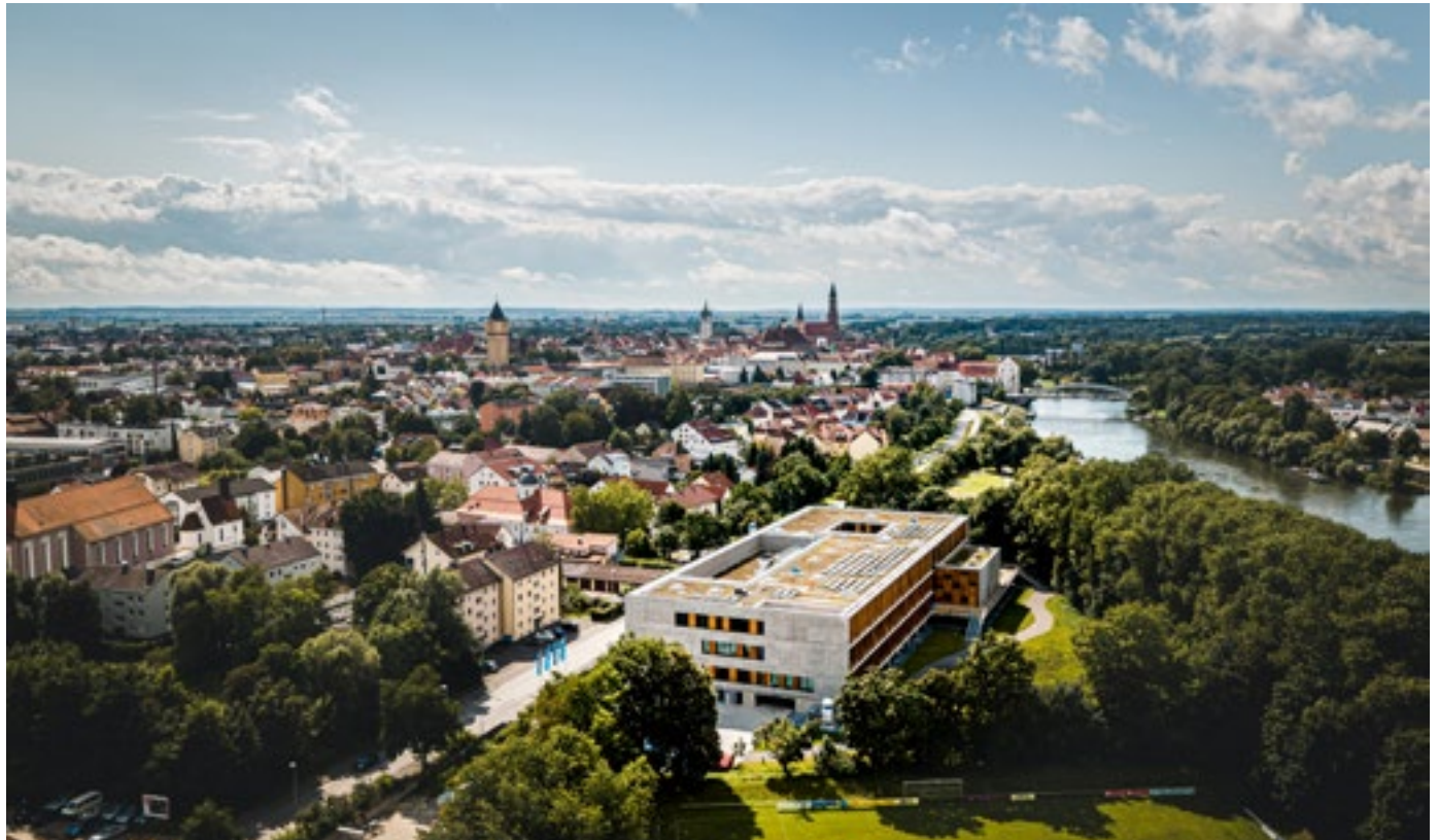
Neubau „Nachhaltige Chemie“ und Verwaltungsgebäude Petersgasse 5 an der Uferstraße in Straubing, im Hintergrund die Innenstadt