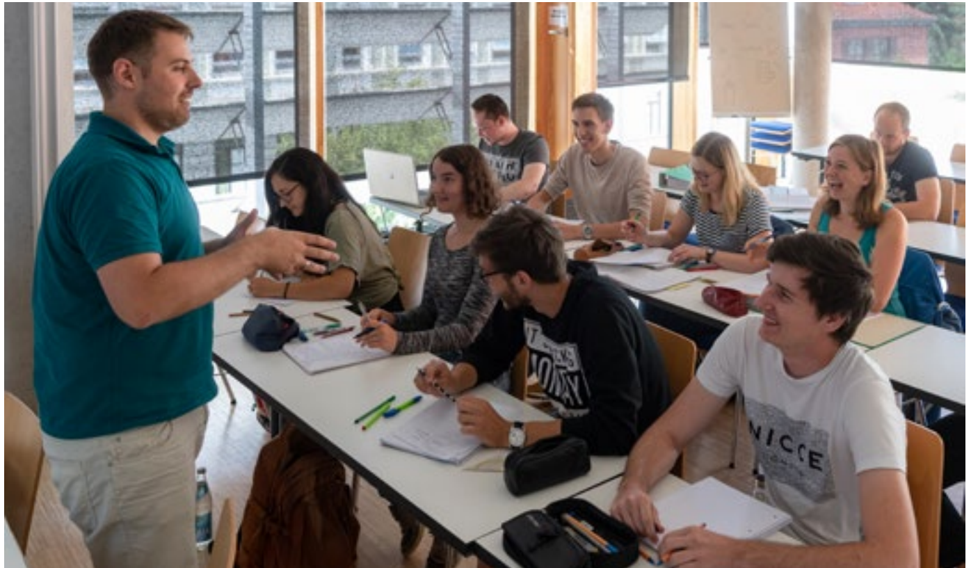
Prof. Burger und Studierende während einer Lehrveranstaltung